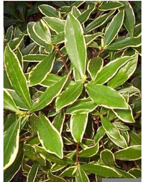
Daphne odora 'Aureomarginata'